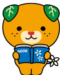
愛媛県イメージアップキャラクター みきちゃん